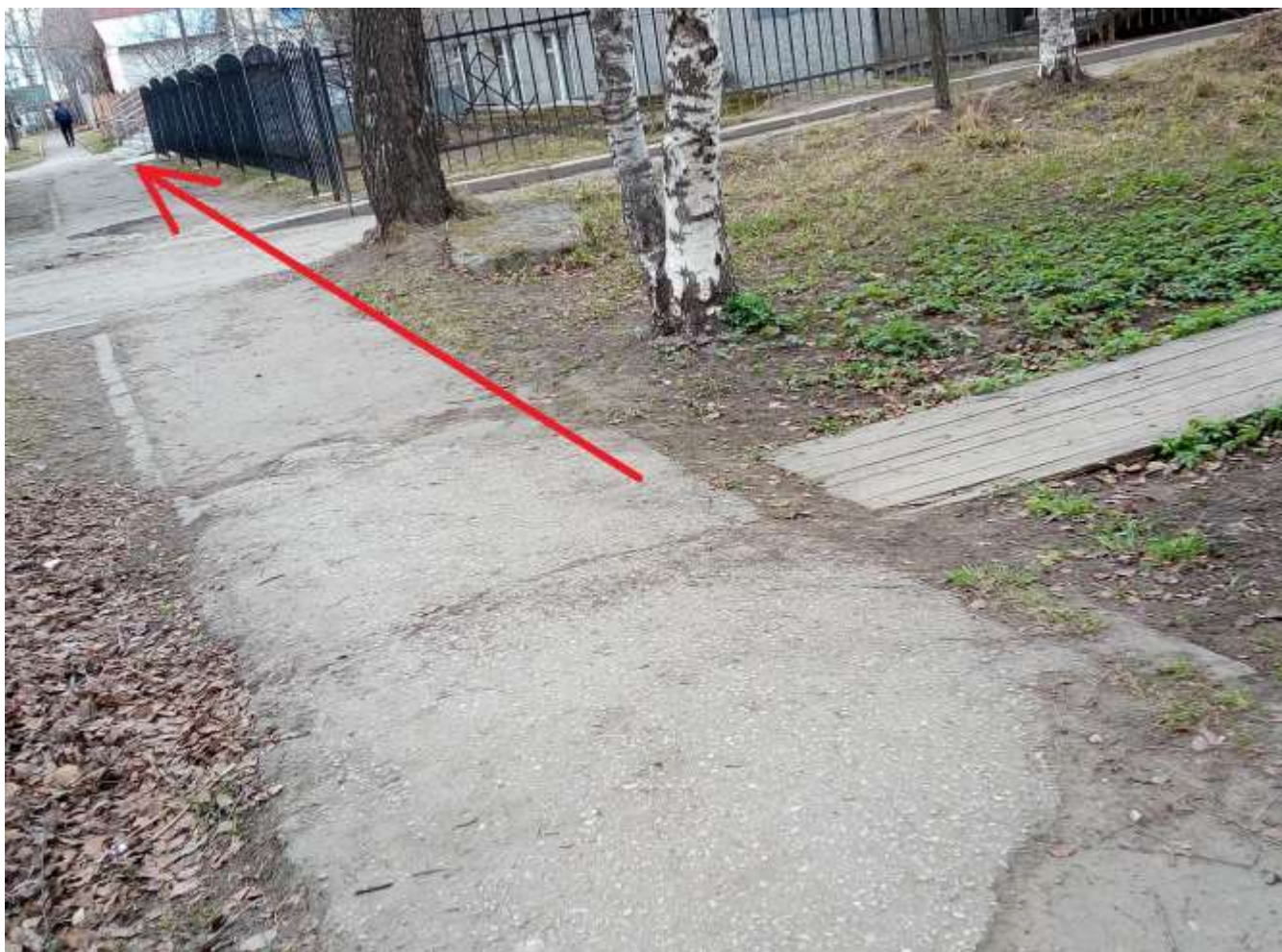
Здание МАУДО "Сыктывкарская музыкально-хоровая школа"