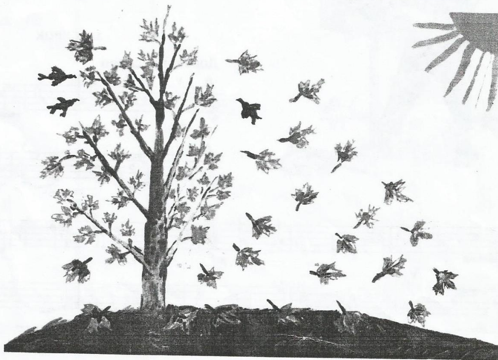
Рис. Нагерняк Каролины