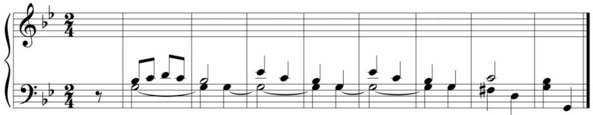
«Старинная французская песня»